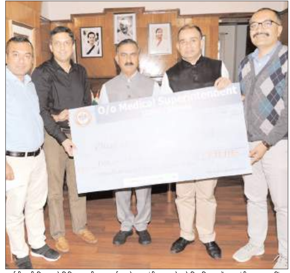
आईजीएमसी शिमला के चिकित्सा अधीक्षक कार्यालय ने मुख्यमंत्री राहत कोष के लिए शिमला में मुख्यमंत्री टाकुर सुखविंदर सिंह सुखू को 5 लाख 11 हजार 111 रुपये का चेक भेंट किया।