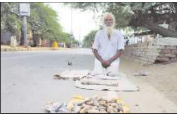
फोटो परिचय- दंडवती परिक्रमा लगाते गिरिराज जी के भक्त।

मथुरा/टीएम एक्शन इंडिया श्रावण मास में गिरिराज जी की सप्तकोसीय परिक्रमा का विशेष महत्व है। दंडवती परिक्रमा अनूठी भक्ति है। पर्वतराज की भक्ति अनूठी तो भक्त भी निराले हैं। तमाम भक्तों ने अपना जीवन मानो प्रभु भक्ति को समर्पित कर दंडवती परिक्रमा शुरू कर दी है। इनमें तमाम वृद्ध और युवा हैं 1161 और 108 निशान लेकर दंडवती परिक्रमा कर रहे हैं। गोवर्धन पर्वत की शिलाओं में भगवान श्रीकृष्ण की बाल लीलाओं के संरक्षित चिन्ह रहस्यमयी दिव्यता की गवाही दे रहे हैं। प्रभु की 21 किमी की परिक्रमा कर मनोकामना पूरी होने के लिए करोड़ों लोग आज भी