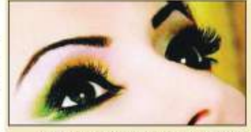
आंखों में केवल दुनिया दिखाने में मददगार होती हैं, बल्कि ये खतरों को भांपने में भी दिमाग से ज्यादा तेज होती हैं। एक नए अध्ययन में यह खुलासा हुआ है। यह शोध स्विट्जरलैंड के बेसल स्थित फ्रेडरिक नाइसर

ऐसा होता है निर्माण: कैल्सियम-रिलेक्सेशन में सहायक कैल्शियम दांतों व हड्डियों का निर्माण करता है।